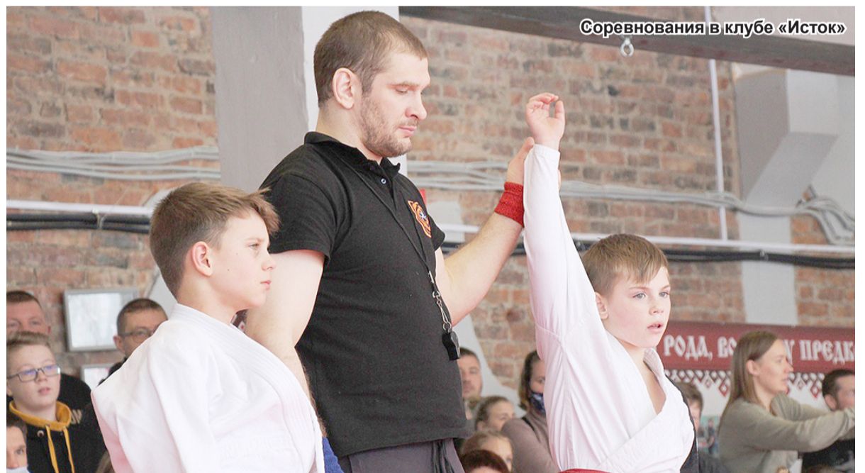
Соревнования в клубе «Исток»