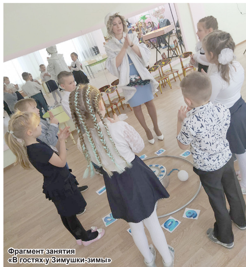
Фрагмент занятия «В гостях у Зимушки-зимы»

Константин КАШИН Фото из архива комитета образования Подпорожского района