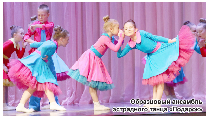
Образцовый ансамбль эстрадного танца «Подарок»

«Мы так скучали по живым выступлениям. Вы не просто дали эту возможность, но и круто провели фестиваль: красивые дипломы и памятные сувениры, помощь кураторов и внимательное отношение всех работников, бесперебойная работа звукооператоров, справедливое жюри. Огромное спасибо организаторам. До новых встреч!»