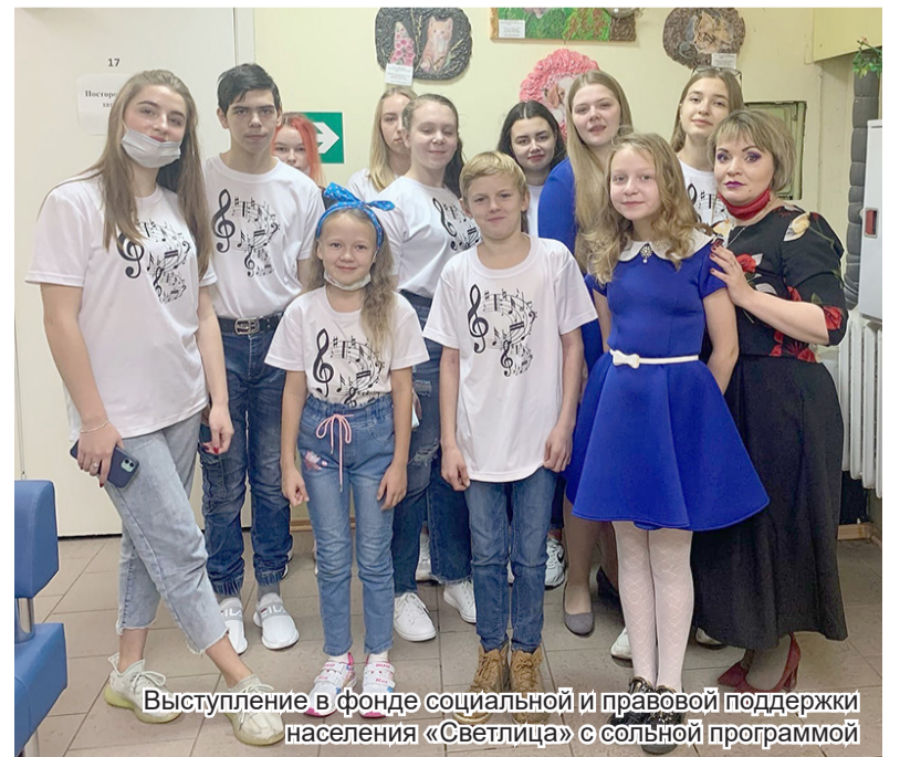
Выступление в фонде социальной и правовой поддержки населения «Светлица» с сольной программой

- Только участвуя в различных конкурсах и фестивалях. Часто члены жюри запоминают конкурсанта, тогда могут подойти и дать совет, что особенно ценно и важно. Это касается не только начинающих артистов, со мной лично был подобный случай на одном из фестивалей. На отборочный тур я представила две песни, жюри