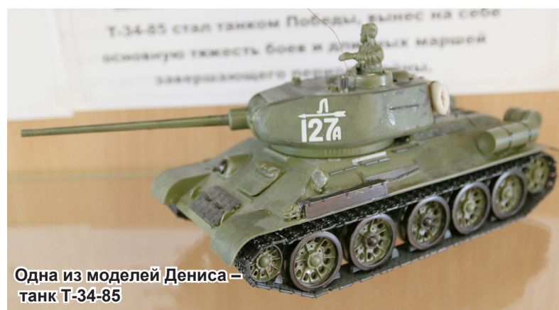
Одна из моделей Дениса – танк Т-34-85