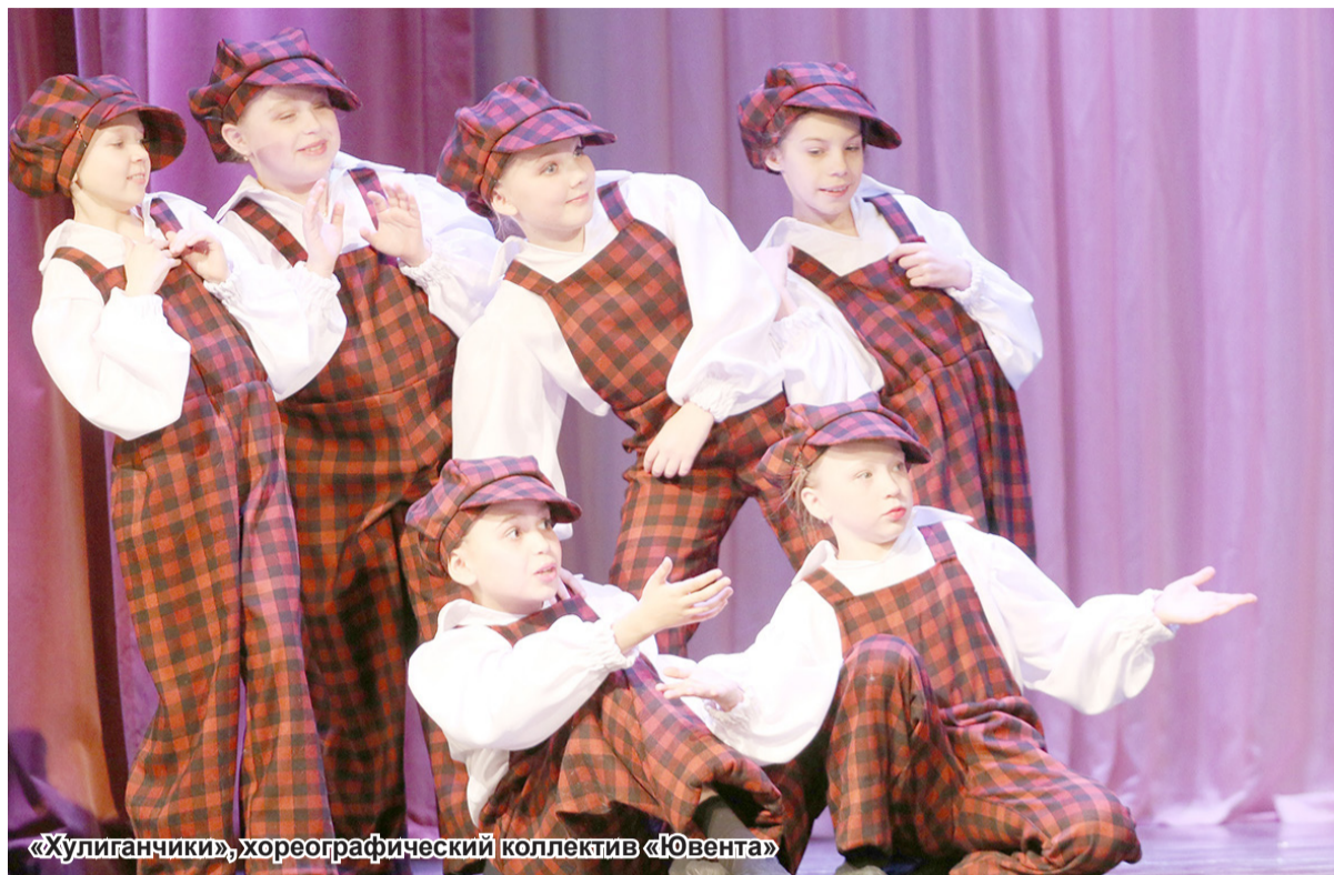
«Хулиганчики», хореографический коллектив «Ювента»

В Подпорожском культурно-досуговом комплексе 22 февраля прошёл грандиозный по своим масштабам V открытый хореографический фестиваль-конкурс «Танцевальная россыпь Присвирья». В мероприятии приняли участие коллективы из Санкт-Петербурга, Киришей, Лодейного Поля и Подпорожья, а также из Всеволожского, Ломоносовского, Киришского, Сланцевского и Подпорожского районов. Около четырёхсот участников из разных творческих коллективов показали со сцены девятнадцать танцев. Фестиваль состоял из двух отделений и продолжался около восьми часов. Учредителями мероприятия стали администрация Подпорожского района и Подпорожский культурно-досуговый комплекс при информационной и методической помощи Государственного бюджетного учреждения культуры Ленинградской области «Дом народного творчества». На фестивале были представлены коллективы и отдельные участники в разных возрастных категориях и номинациях: эстрадный и современный танец, народный и стилизованный танец, классический танец, детский танец, а также малые формы, солисты и дуэты.