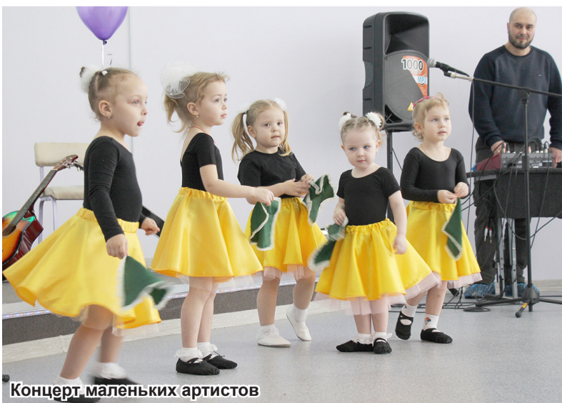
Концерт маленьких артистов