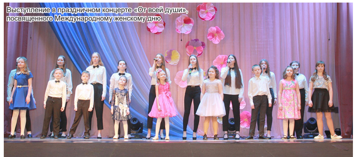
Выступление в праздничном концерте «От всей души», посвящённого Международному женскому дню

иногда сложнее петь – можешь не попасть в слова. Фонограмму можно использовать только в редких случаях, когда, например, надо выступать на улице в минус сорок или ты заболел, а выступление не отменить, и то только профессионалам. Дети под фонограмму петь не должны, иначе они перестают стараться.