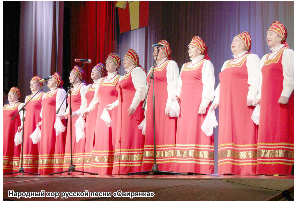
Народный хор русской песни «Свирянка»

Под таким названием 8 марта прошёл праздничный концерт, посвящённый Международному женскому дню в Подпорожском культурно-досуговом комплексе.