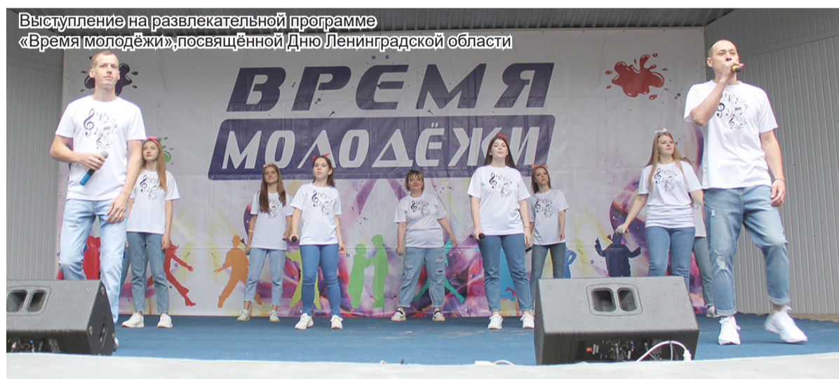
Выступление на развлекательной программе «Время молодёжи», посвящённой Дню Ленинградской области

Антонина ГЕРАСИМОВА Фото из личного архива Александр ДЕМАШКЕВИЧ