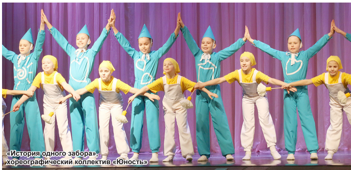
«История одного забора», хореографический коллектив «Юность»