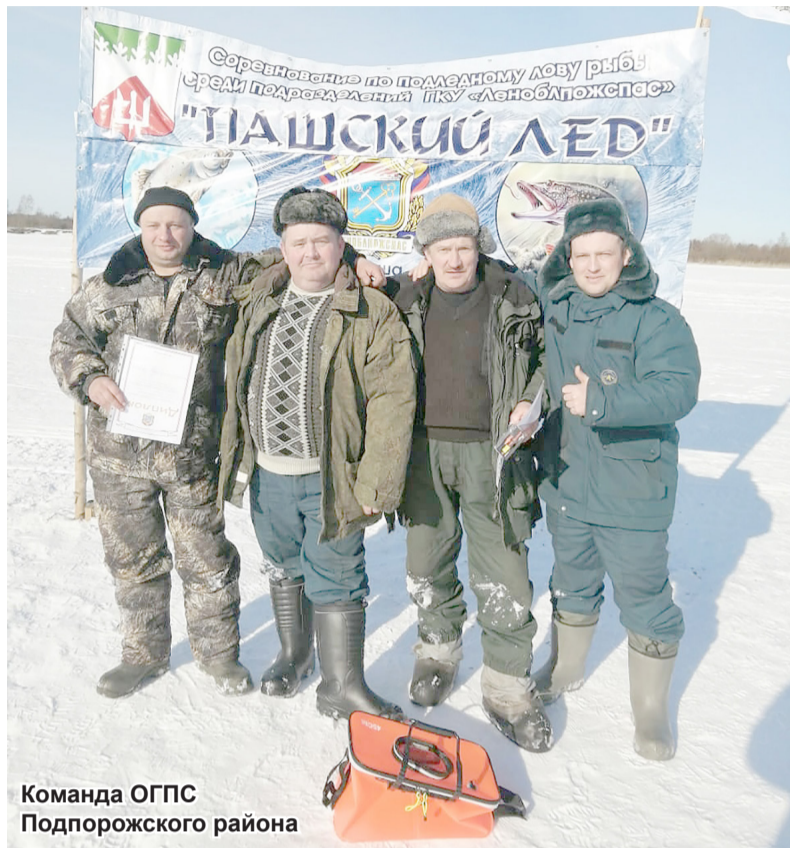
Команда ОГПС Подпорожского района

Среди видов ловли зимняя рыбалка стоит особняком. Это продиктовано тем, что снасти здесь совершенно другие, а условия более суровые. У каждого рыбака есть свои секреты и уловки, чтобы поймать долгожданные трофеи. Только разгадав секреты игры мормышки, ловли на блесну, и научившись сохранять живца,